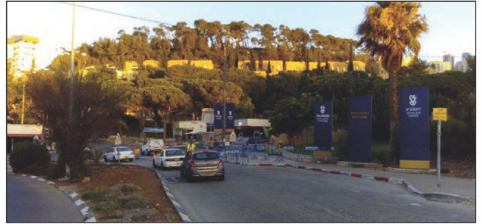
Abbildung 3. West Gate des Technions