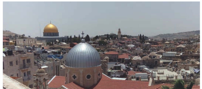
Abbildung 4. Kampf um die spirituelle Lufthoheit